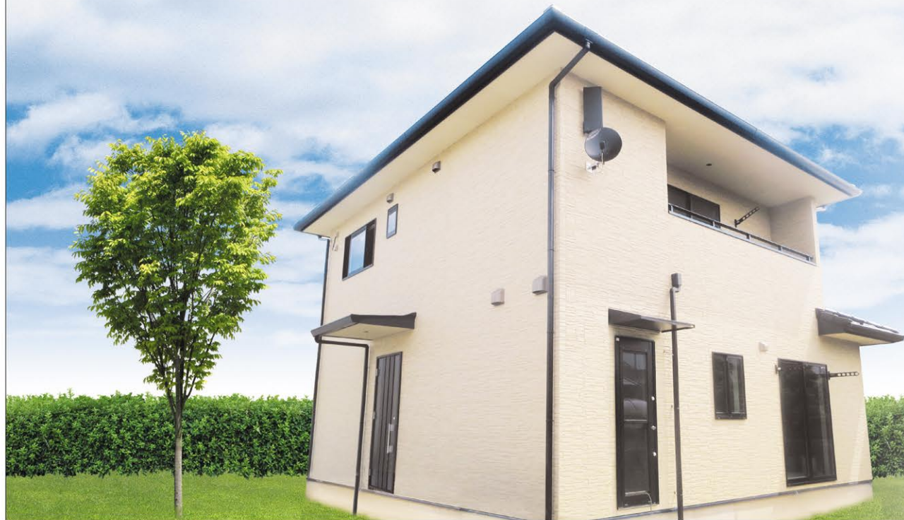
※写真はイメージです。

岡山市中区倉益 7/23(木祝)・24(金祝)・25(土)・26(日) AM10:00~PM6:00 [雨天決行]